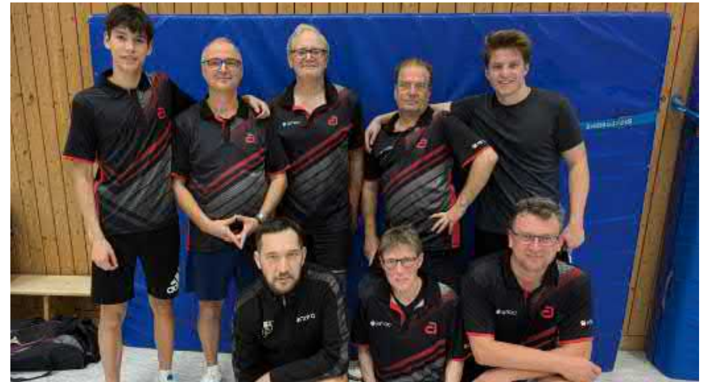
Termin Heim Gast 06.01.2026 20:00 SC Union Lüdinghausen V TuS Sythen 27.01.2026 20:00 SC Union Lüdinghausen V TuS Haltern VI 03.02.2026 20:00 SC Union Lüdinghausen V SW Havixbeck 21.02.2026 18:30 TTV Waltrop 99 IV SC Union Lüdinghausen V 24.02.2026 20:00 SC Union Lüdinghausen V TTC Marl-Hüls II 04.03.2026 20:00 SV Arminia Appelhülsen II SC Union Lüdinghausen V 10.03.2026 20:00 SC Union Lüdinghausen V DJK Westfalia Senden IV 20.03.2026 19:00 TTC Horneburg III SC Union Lüdinghausen V 24.03.2026 20:00 SC Union Lüdinghausen V TuS Ascheberg III 14.04.2026 19:30 DJK Westfalia Senden V SC Union Lüdinghausen V